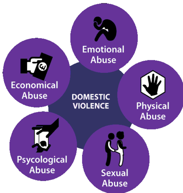
Obr. 2: Formy domácího násilí 65

psychické násilí, zahrnuje slovní napadání, jehož příkladem jsou nadávky či zesměšňování, fyzické násilí poté nabývá podoby potyček, kopanců či cloumání. Podle délky trvání rozeznáváme násilí dlouhodobé, situační a násilí v podobě incidentů (náhlých neočekávaných násilných projevů s krátkým intenzivním průběhem). 33 Součástí domácího násilí je i emocionální násilí, které je většinou cíleno vůči dětem, oblíbeným věcem, zvířatům atp. Může dojít i k zamezení kontaktu s přáteli, což je typické pro sociální násilí. V některých případech dochází také k omezování uspokojování základních potřeb, jako je dostatek potravy či oblečení, čímž se dostáváme do kategorie ekonomického násilí. 34 35