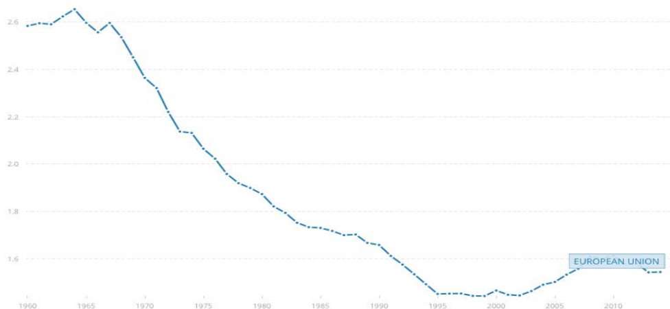
Graf 1: Vývoj fertility v EU od roku 1960 10